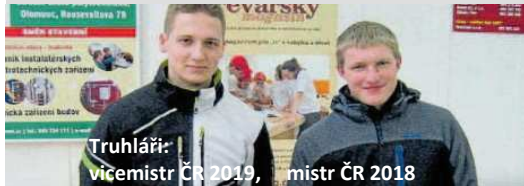
Truhláři: vicemistr ČR 2019 , mistr ČR 2018