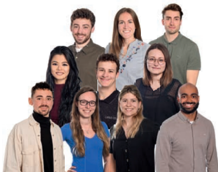
und das Team Kursbetreuung